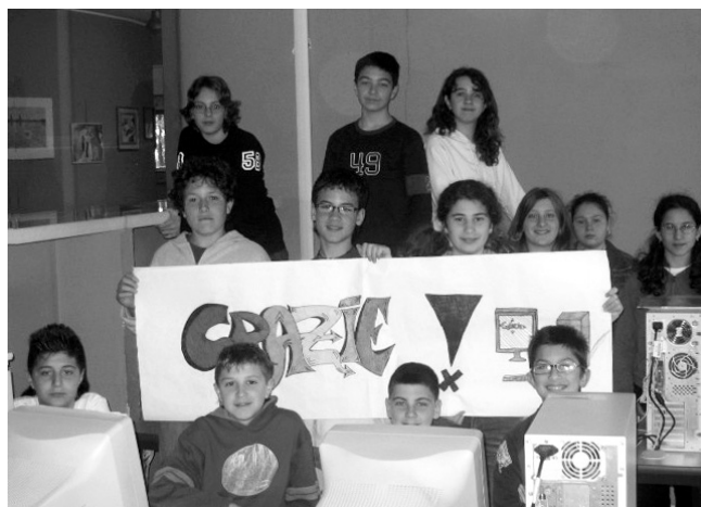
I ragazzi della Scuola media ringraziano il loro "eroe"

Il C.S.E. è aperto dal lunedì al venerdì dalle 8.15 alle 15.20. Per informazioni tel.039.692218.