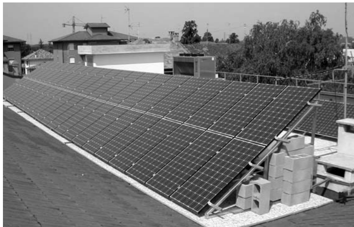
L'impianto fotovoltaico installato sul tetto del palazzo comunale - Cornate d'Adda

Purtroppo qui da Noi, si è preferito incentivare quei pochi imprenditori privati che producono energia con centrali che utilizzano fonti rinnovabili ed assimilate.