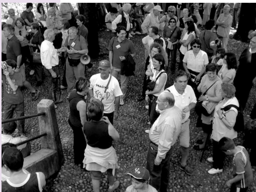
Inaugurazione della Pro Loco - Rocchetta

Partendo da queste considerazioni si è pensato di fondare una Pro Loco. Dal mese di settembre dello scorso anno è stato formato un gruppo di studio che si è mosso in due direzioni fondamentali. Primo, si è cercato di capire il funzionamento di una Pro Loco, contattando quelle già esistenti nei paesi limitrofi, in secondo luogo si sono studiati gli aspetti caratteristici del nostro territorio.