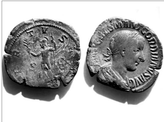
Moneta romana con il volto dell'imperatore romano Gordiano III (238-244 d.C.)

L'archeologia a Cornate da semplice sfida iniziale è diventata una grande opportunità non facile da gestire. Si prevedono tempi lunghi, forse alcuni decenni. Sarebbe opportuno, sin d'ora, predisporre un piano di intervento globale alla ricerca di uno sponsor istituzionale e di possibili contributi dalla Regione e dalla Provincia. La neonata Proloco potrebbe avere un ruolo strategico e rappresentare elemento di continuità con l'alternarsi delle amministrazioni future.