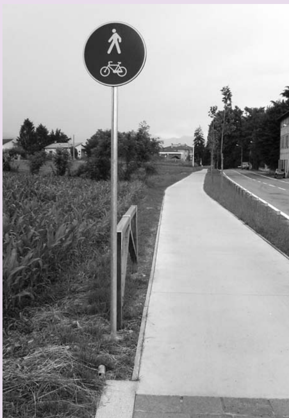
Veduta della nuova ciclabile Cornate - Porto d'Adda

13. È in fase di elaborazione il progetto di riqualificazione della via Lanzi a Colnago; i lavori inizieranno entro l'autunno.