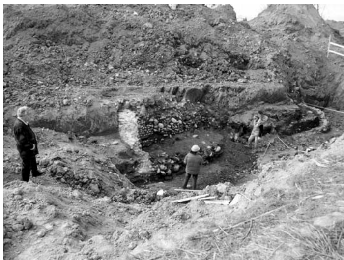
Cisterna romana, i suoi muri sono simili, per solidità e struttura, alle mura di fondazione del palazzo imperiale di Massimiano in via Brisa a Milano.