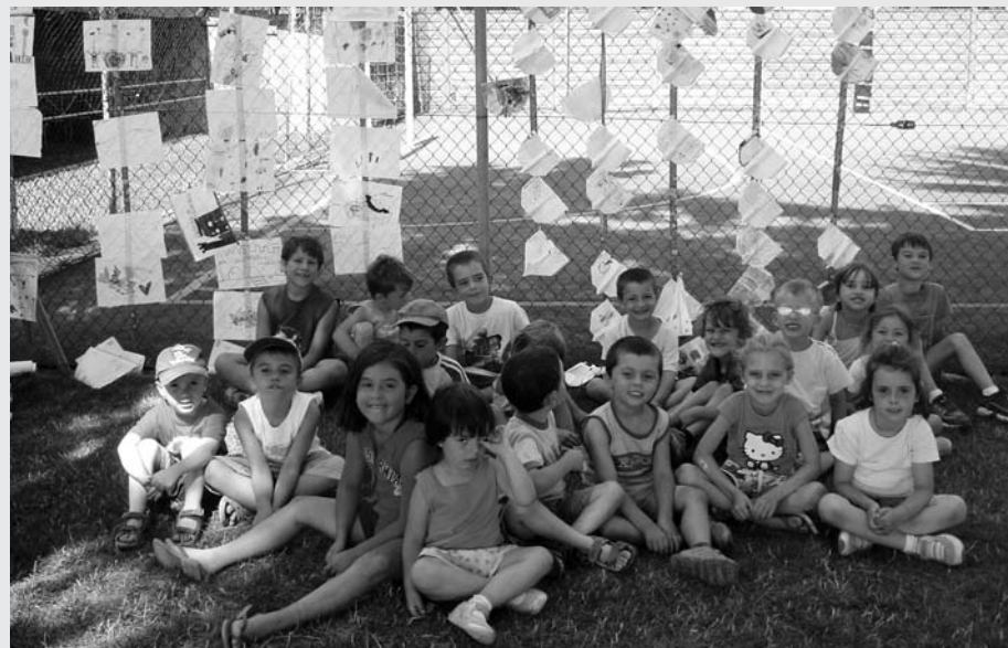
Un gruppo di bambini con le proprie opere di pittura - Cornate d'Adda

Non è mancata la grande festa finale, aperta a genitori ed amici, con merenda e, grande novità, una divertente caccia al tesoro.