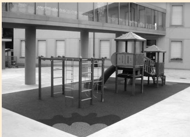
Il nuovo Parco Giochi della Scuola Elementare - Colnago

6. È in corso il concorso di riqualificazione delle piazze cittadine di Cornate, Colnago e Porto d'Adda; entro natale il concorso sarà concluso