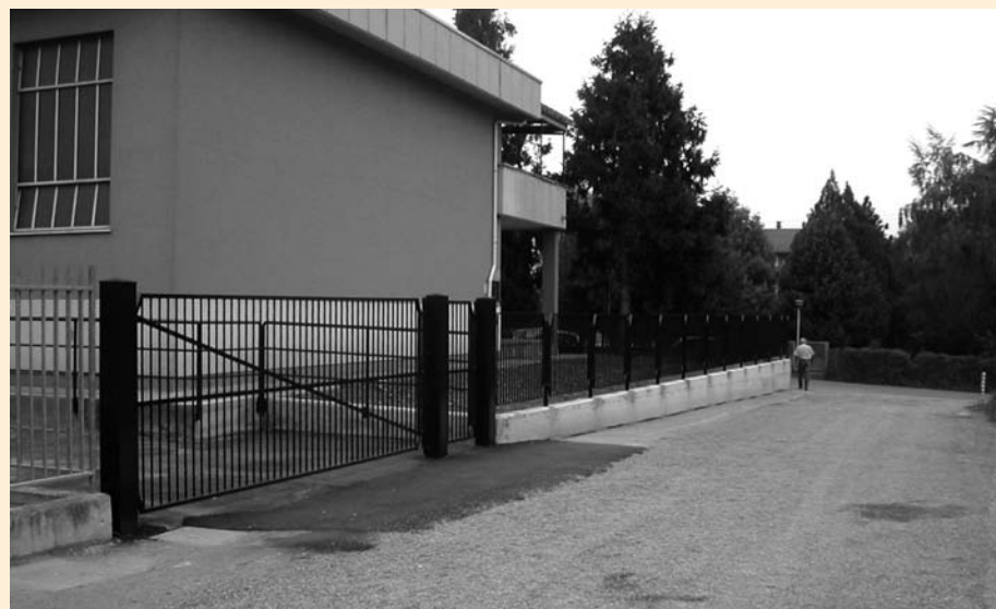
Nuovo accesso carraio e pedonale presso la scuola elementare - Colnago

10. È in corso di definizione il restauro della struttura tombale romana collocata nel giardino del palazzo comunale .